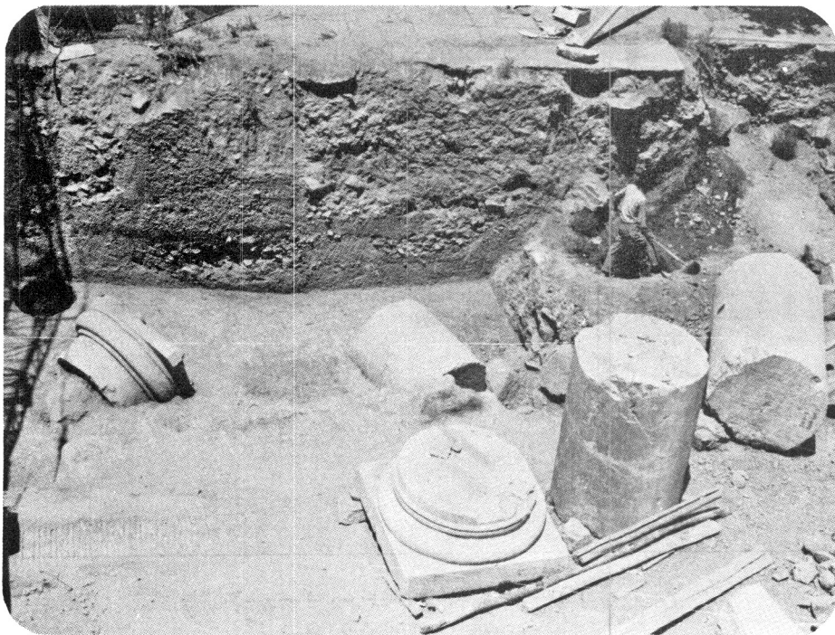
نقش قزلباش بر روی میان ستون ، مجاور پایه ستون نقر گردیده

فارس مورد بازیابی و مرمت و انجام عملیات فولادگذاری قرار گرفت که در ضمن انجام اقدامات موردنظر به نقشی برخورد گردید که با خطوط ظریف و نازک بر روی بدنه میان ستون حک شده بود و چنین تصور می‌رود که شخص ترسیم کننده در حالیکه ستون موردنظر ایستاده و بر جای خود بوده است، اقدام به ایجاد نقش بر بدنه میان ستون نموده زیرا با توجه به موقعیت کشف آن به نظر می‌رسد سالها بعد بر اثر عوامل تخریب میان ستونها فروریخته است (لازم بیادآوری است که تا سال ۱۸۴۸ میلادی زمان بازدید فلاندن و کست طراح و معمار فرانسوی این ستونها بر پا و بر اساس طرحهای موجود فقط چند ردیف از سنگهای دیوار از خاک بیرون بوده و تعداد ۹ ستون بر پا در جوار ساخت و سازه‌های فراز آن دیده می‌شود احتمالاً قبل از آن زمان، تصویر مذکور حک شده است. نقش این تصویر با مقایسه با پرتوها و تصاویر دوره صفویه شبیه تصویر قزلباش‌های این دوره می‌باشد. بنابراین تاریخ حک این نقش نمی‌تواند از این دوره